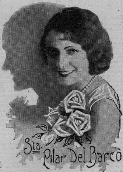
Sta. Pilar Del Barco